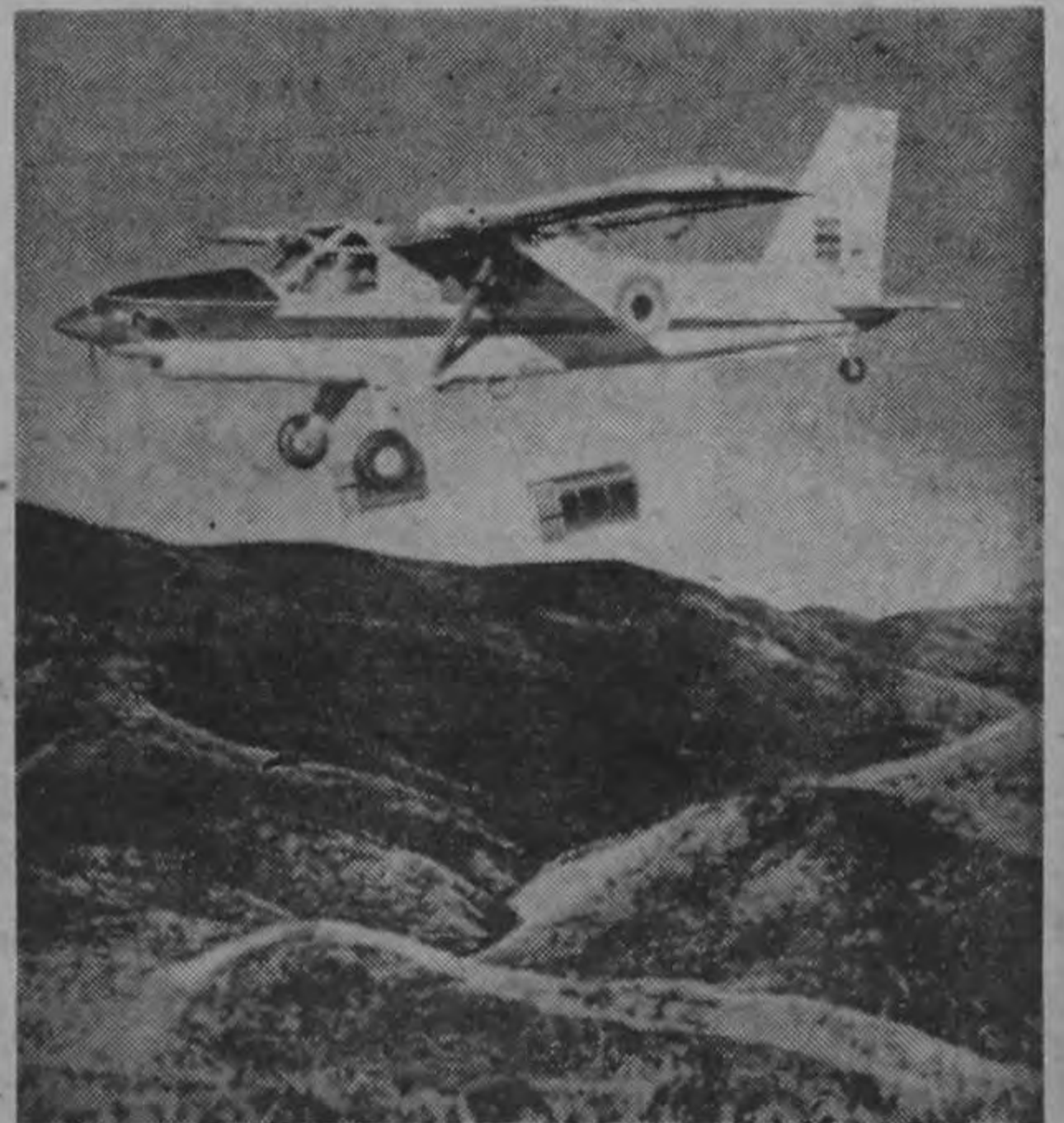
EL "TURBO-BEAVER" PUEDE ACTUAR EN EMERGENCIAS. La gráfica muestra al versátil aparato lanzando bultos de carga en una presunta zona aislada. El avión puede trabajar en casos de emergencia, suministrando desde el aire alimentos y medicinas. La escasa velocidad a que puede volar hace que los bultos de carga no se pierdan ni por el choque ni por que caigan a gran distancia. (De Havilland Photo).