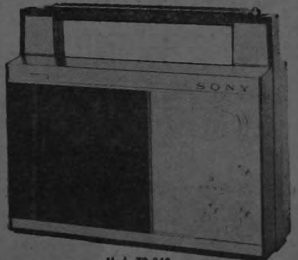
Mod. TR-840 Magnífico radio portátil de 3 bandas y 8 transistores. Volumen potente sin distorsión y control continuo de todo. Iluminación en el dial para sintonización en la oscuridad.

Amplio surtido de radios SONY desde una hasta cuatro bandas.