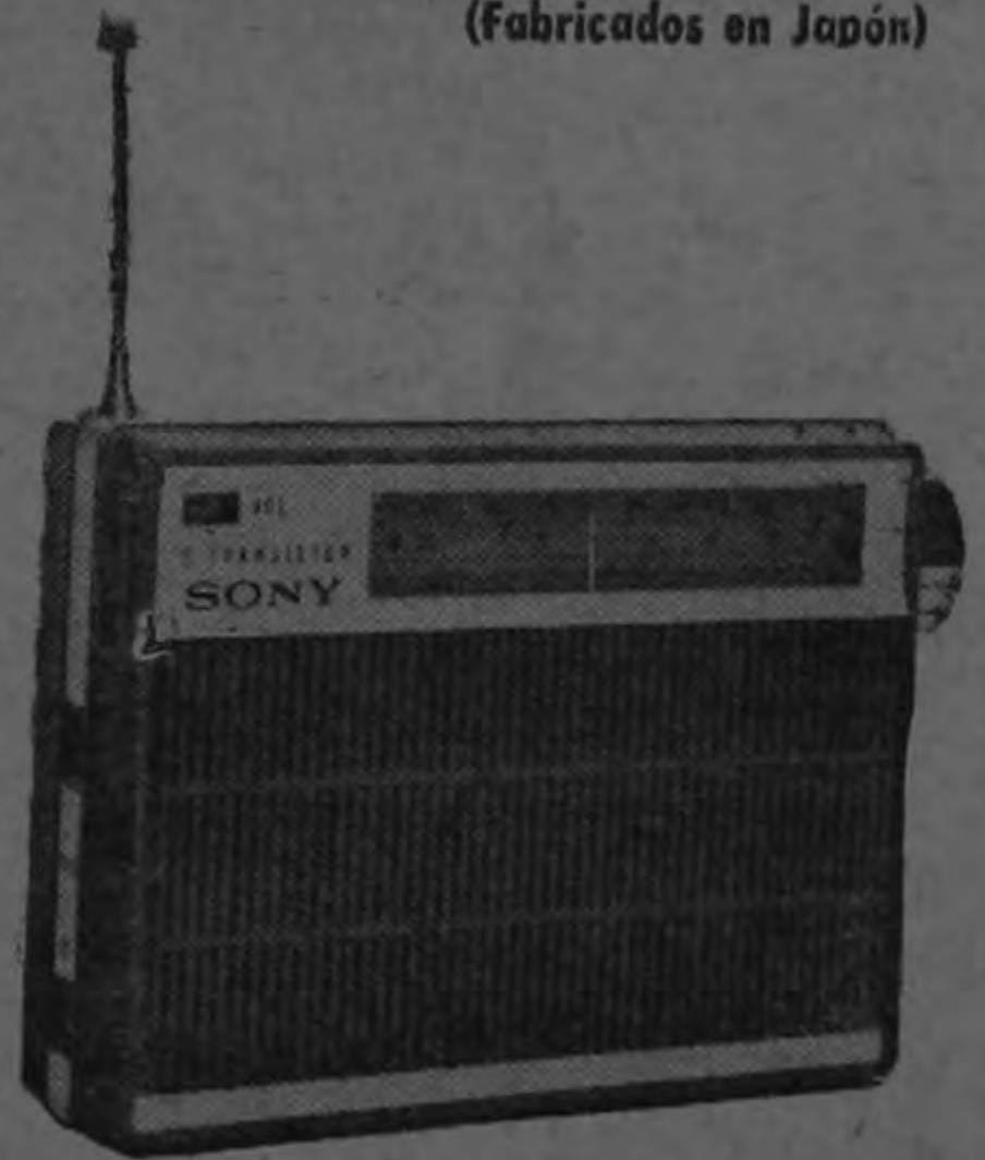
Mod. TR-842 Potente modelo de 2 bandas y 8 transistores, con control de tonos y conexión para audífono. Con estuche de cuero.