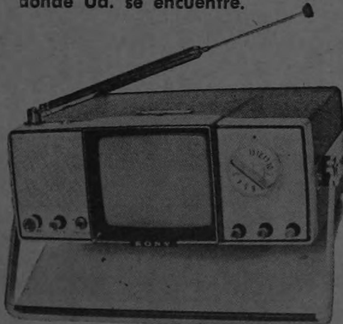
Nuevo MICRO-TELEVISOR "SONY" con pantalla de 4 pulgadas. Funciona en cualquier parte, con pilas de foco, con la batería del carro o con la corriente eléctrica de 110 V. ¡Pesa sólo 6 libras!

Estará bien informado de todo, en cualquier parte donde Ud. se encuentre.