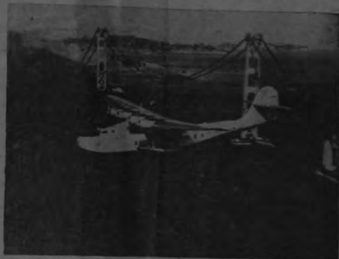
ASI SE HACE LA HISTORIA.— La fotografía capta el momento en que el China Clipper de Pan American Airways deja atrás la estructura inconclusa, del famoso puente Golden Gate, iniciándose así la primera etapa del primer vuelo transpacífico a Manila en 1935.

Ya aquí ni escritor elegante puede ser uno.